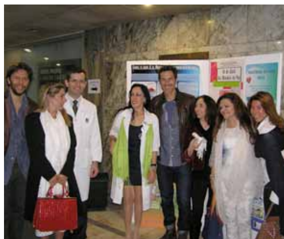
Rastreio da Voz

I Jornadas do Serviço de Oftalmologia do Centro Hospitalar de Lisboa Ocidental