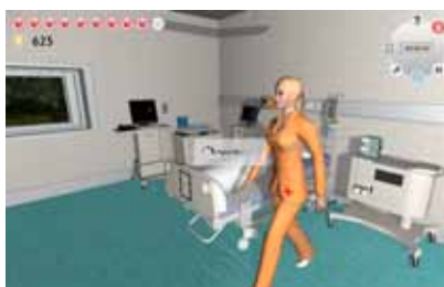
Enfermeira Serviço de Observação

Aprendizagem. Está demonstrado que a aprendizagem no adulto é muito mais eficaz quando orientada por problemas, de forma interactiva e com feedback imediato.