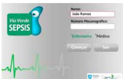
Ecrã de entrada

Simulação. Em áreas em que a segurança é crítica, como por exemplo na aviação, o treino através de simulação é já uma realidade há muitos anos. Não existe piloto que não tenha passado muitas horas num simulador de voo antes de assumir a responsabilidade por um avião.